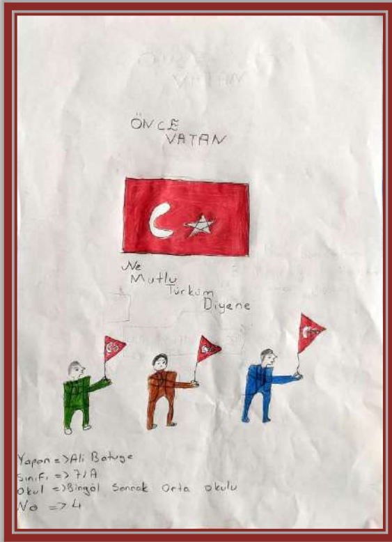
ALİ BATUGE - 7/A