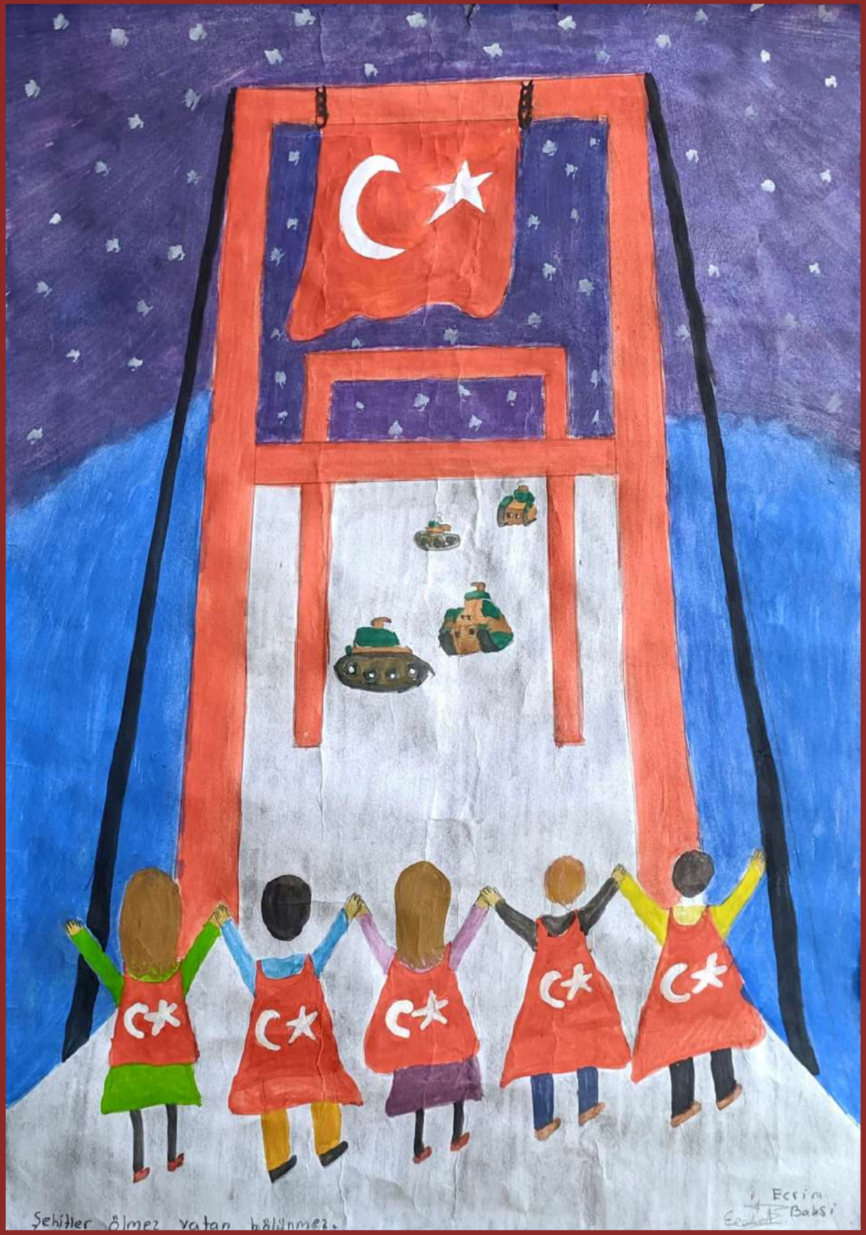
ECRİN BAKŞİ - 7/A