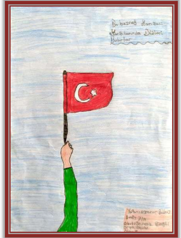
AZRANUR BALBARS - 7/A